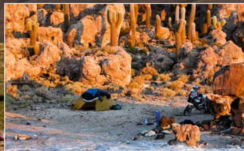
Een werkelijk uniek kampeerplekje, aan de rand van de zoutvlakte Salar de Uyuni.

De extra fles benzine knoop ik boven op mijn bagage, samen met een extra tweeliterfles water. Ik rijd het kleine Uyuni uit over een langgerekt vlak zandpad, op weg naar de zoutvlakte. De overgang van het stoffige zand naar het heldere witte zout gaat in etappes. Eerst wordt alles grijsbruin, daarna grijs en vervolgens grijswit. Ik zigzag om een aantal bergen zout heen, die klaarstaan voor transport. Met één voet aan de grond rijd ik de harde, witte zoutkorst op. Het voelt als een volledig bevroren IJsselmeer en ondanks dat ik weet dat het hard is, blijf ik met mijn voet aan de grond rijden om dit constant te kunnen controleren. Ik stop bij een vrachtwagen en vraag ter bevestiging aan de werklui de richting van het eiland waar ik naartoe wil. Beiden wijzen ze in een andere richting, wat niet echt veel vertrouwen geeft. Gelukkig is het midden van de richting ongeveer dezelfde richting die mijn GPS ook aangeeft, het zal dus wel kloppen. Naarmate de kilometers toenemen >