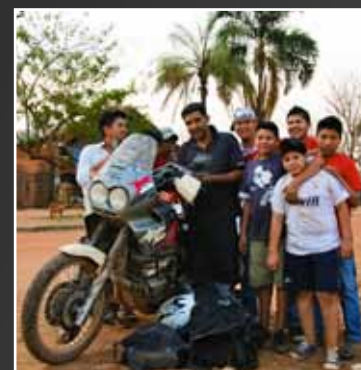
De bevolking is arm, maar ook meer dan vriendelijk. Zolang ze je portemonnee niet jatten tenminste.