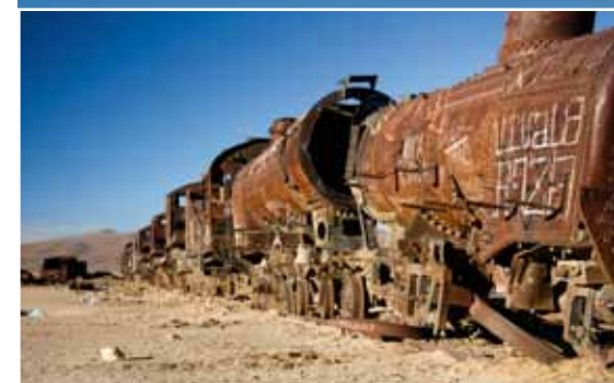
Afgedankte stoomlocomotieven midden in de woestijn, rechts 'zoutdelvers' in de Salar de Uyuni.

boel tot stilstand. Lijf en leden lijken gelukkig in orde, ik sta op en spring een paar keer om dit te verifiëren en om vervolgens luidkeels te vloeken. Het asphalt is 'versierd' met mijn hele hebben en houden, koffer, tas, fles benzine, statief. De hele boel eerst maar op een hoop gooien en kijken hoe de motor de val heeft overleefd. Vrijwel ongeschonden gelukkig, waarbij een korte inspectie leert dat een lekke voorband waarschijnlijk de oorzaak van deze onbedoelde asfaltexcursie is geweest. Het is al geruime tijd donker wanneer ik op mijn tandvlees aankom in Oruro. Ondanks het ongemak heb ik toch de geplande dagafstand gehaald. Onderweg kom ik langs een winkelje met motoronderdelen en die hebben gelukkig een nieuwe binnenband op voorraad. Weten bovendien wel een goed hotelletje, slechts tweehonderd meter verderop. Het kost de hoofdprijs, maar ik kan wel de motor binnen stallen. Nog voor elven lig ik met een driftig kloppend hart in bed. De volgende dag staat La Paz op de planning. Het geluk lacht me toe als een aardige jongeman in een nieuwe auto me zegt hem te volgen wanneer ik hem de weg vraag. Nog geen vijftien minuten later sta ik in het oude centrum van La Paz, zoek een hotelletje en